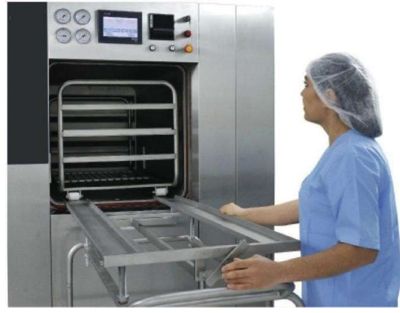
Rafın manuel olarak yüklenmesi/boşaltılması