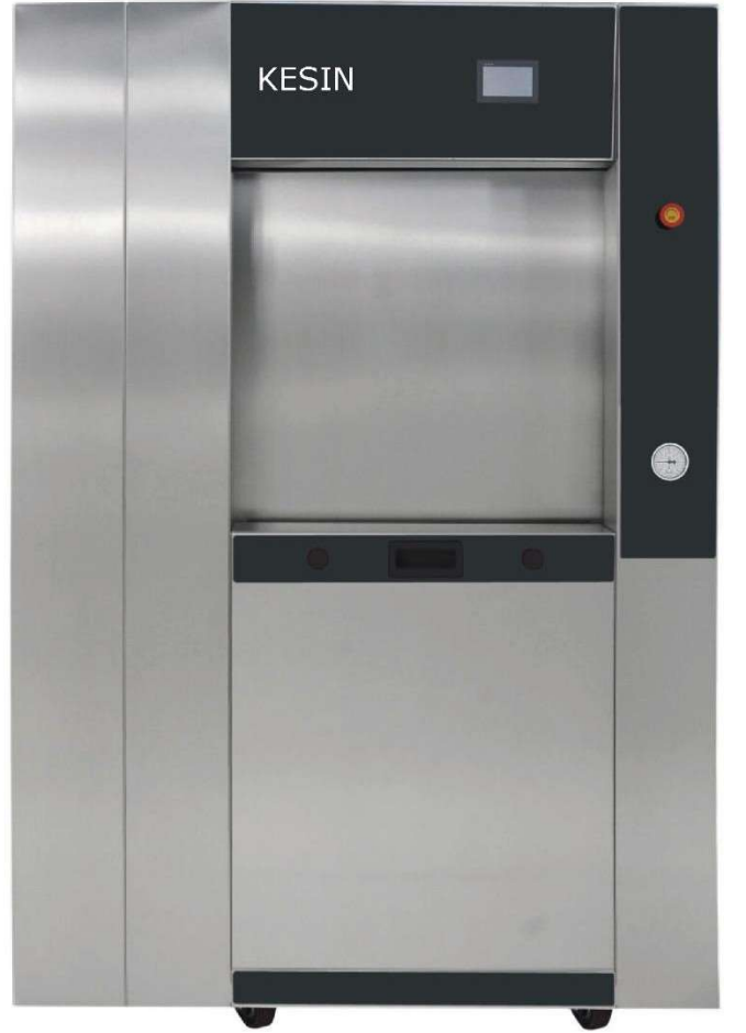
Boşaltma tarafı (çift kapılı versiyon)