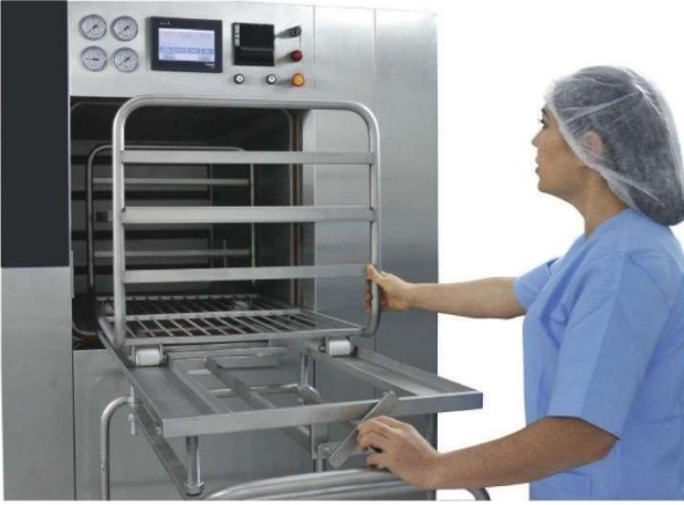
Tel sepetlerin manuel olarak yüklenmesi/boşaltılması

KESIN KM serisi otoklavlar, sepetler ve kaplar için eksiksiz, verimli, ekonomik, tarımsal taşıma sistemleri sunar. Sistemler ayrı ayrı veya kombinasyon halinde kullanılabilir. Her iki sistemde de manuel yükleme ve boşaltma mevcuttur. Bu, sisteminizin ihtiyaçlarınıza göre özelleştirilebileceği anlamına gelir.